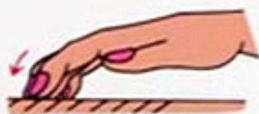
指の第一関節を軽く折るようにして動かす。