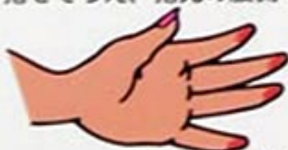
指の腹を上手に使う。