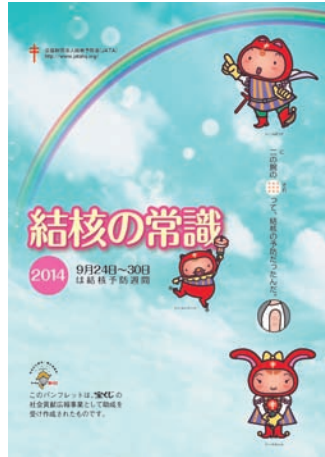
【結核の常識】 ・5分程度で読める結核入門編冊子 ・年1回発行(8月)

なお、数に限りがありますので、 資料がなくなり次第、受付終了と させていただきます。