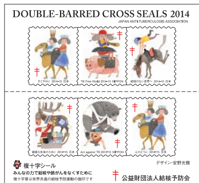
【復十字シール】 ・1枚は切手程度(3.6cm×2.1cm)の大きさ ・裏面は糊付け(シールタイプ) ・毎年絵柄は変わります